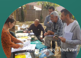
Atelier « Semis à tout va »