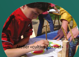
Atelier «cultive ton ciel»

Samedi 31 juillet de 14h à 18h. En continu. Durée de fabrication moyenne : 30min. Tarif : au chapeau. À partir de 5 ans accompagné d'un adulte. À partir de 8 ans en autonomie.